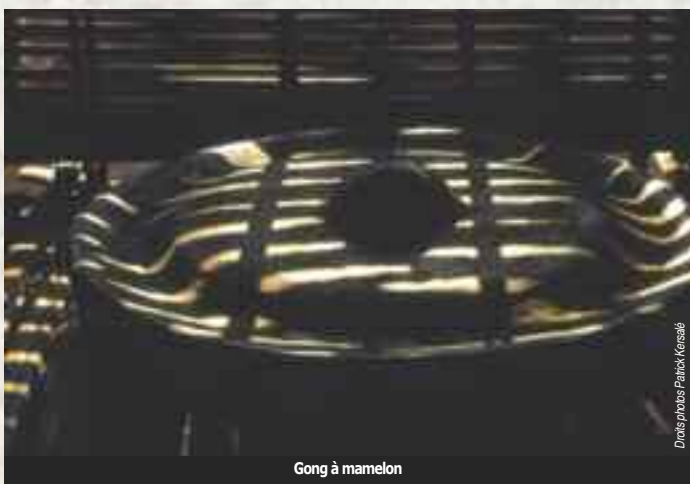
Gong à mamelon

L es minorités ethniques peuplant les hauts plateaux du centre du Viêt Nam ont une véritable culture des gongs joués en ensemble. Ce fait remarquable n'a pas échappé à la vigilance de l'UNESCO puisque les ensembles de gongs ont été inscrits en 2008 sur la Liste représentative du patrimoine culturel immatériel de l'humanité sous la mention « L'espace de la culture des Gongs ». Les ethnies de cette région ne sont pas les seules à posséder et jouer les gongs, les