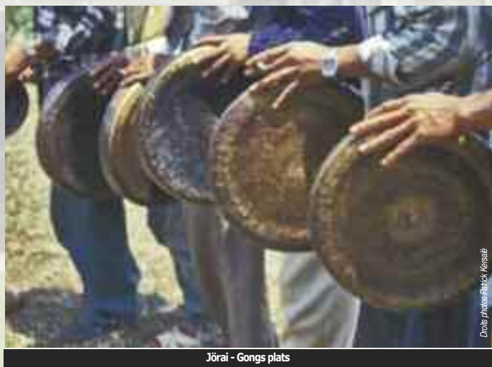
Jörai - Gongs plats

Mường du nord du pays les connaissent eux aussi mais selon une approche musicale différenciée. La culture des ensembles de gongs existe également de l'autre côté de la frontière administrative du Viêt Nam, au sud du Laos et au nord-est du Cambodge. Plus loin encore, en Asie du Sud-Est, des ensembles de gongs existent aux Philippines et en Malaisie.