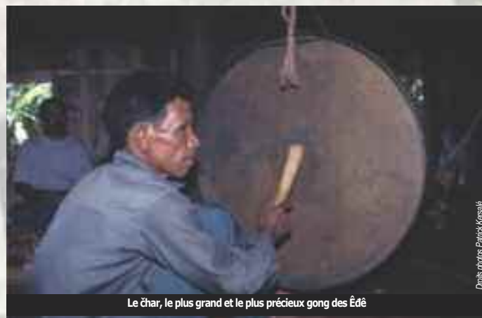
Le char, le plus grand et le plus précieux gong des Êdê

Dans les hauts plateaux du Viêt Nam, on distingue deux types de gongs : les gongs plats et les gongs à mamelon dits aussi gongs à bosse, renflés ou encore bulbés. Ils sont fabriqués artisanalement par martèlement de plaques de bronze préalablement fondues ou récupérées (une tendance bien installée depuis plusieurs décennies). Le bronze est un alliage de cuivre (70% à 80%) et d'étain et/ou plomb (30% à 20%), avec parfois addition d'argent, d'or ou de zinc pour les plus anciens et selon les croyances de ces ethnies. Certaines croyances considèrent qu'il y a aussi du fer dans les gongs. Or, le point de fusion du fer (1538 °C.) est incompatible avec celui du cuivre (1085 °C.) tandis que tous les autres matériaux cités ont un point de fusion inférieur à celui du cuivre, ce qui rend possible leur intégration.