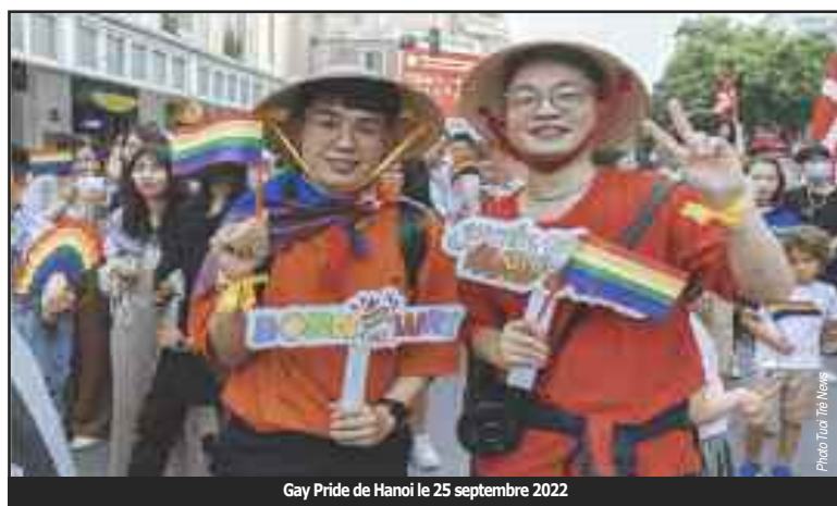
Gay Pride de Hanoi le 25 septembre 2022